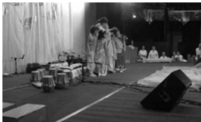
Het tableau vivant, geïnspireerd op de diep bedroefde familie.

gordijnen die de stand afzoomden. Op die manier was het voor iedereen mogelijk om, van waar ook in de zaal, te zien hoeveel huizen op een bepaald moment al waren gesponsord. Op de laatste avond waren na middernacht ruimschoots 8 huizen verzilverd.