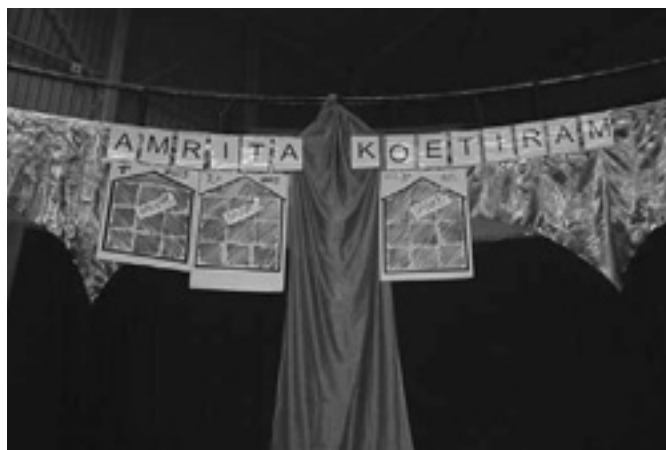
Van overal in de zaal kon men zien voor hoeveel huisjes er geld bijeen was gebracht, ook Amma hield het vanaf haar stoel in het oog.

Alle ontvangsten werden genoteerd, ondermeer om de fameuze barometer bij te werken. Voor het eerst immers werd dit jaar begonnen met het visualiseren van de binnenkomende schenkingen. Op grote tekenbladen was een symbolisch huisje getekend, waarin 10 roosters waren aangebracht. Per gift van 100 € werd één rooster ingekleurd, wat betekende dat 1000 € een volledig ingekleurd huis voorstelde. Een vol tekenblad van een "verkochte" huis werd vervolgens opgehangen bovenaan de zwarte