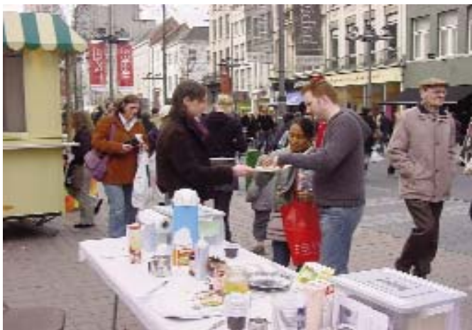
... proevertjes uitdelen ...