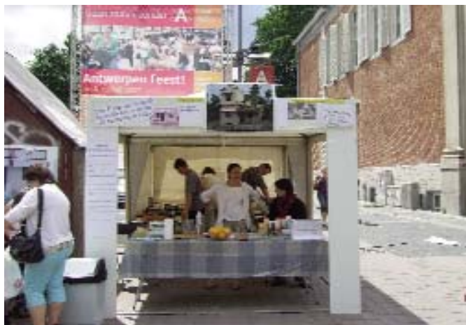
Hartje Antwerpen ...