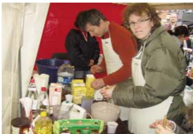
... wafels bakken ...