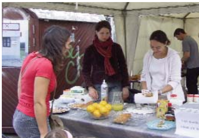
... schenken en ontvangen.