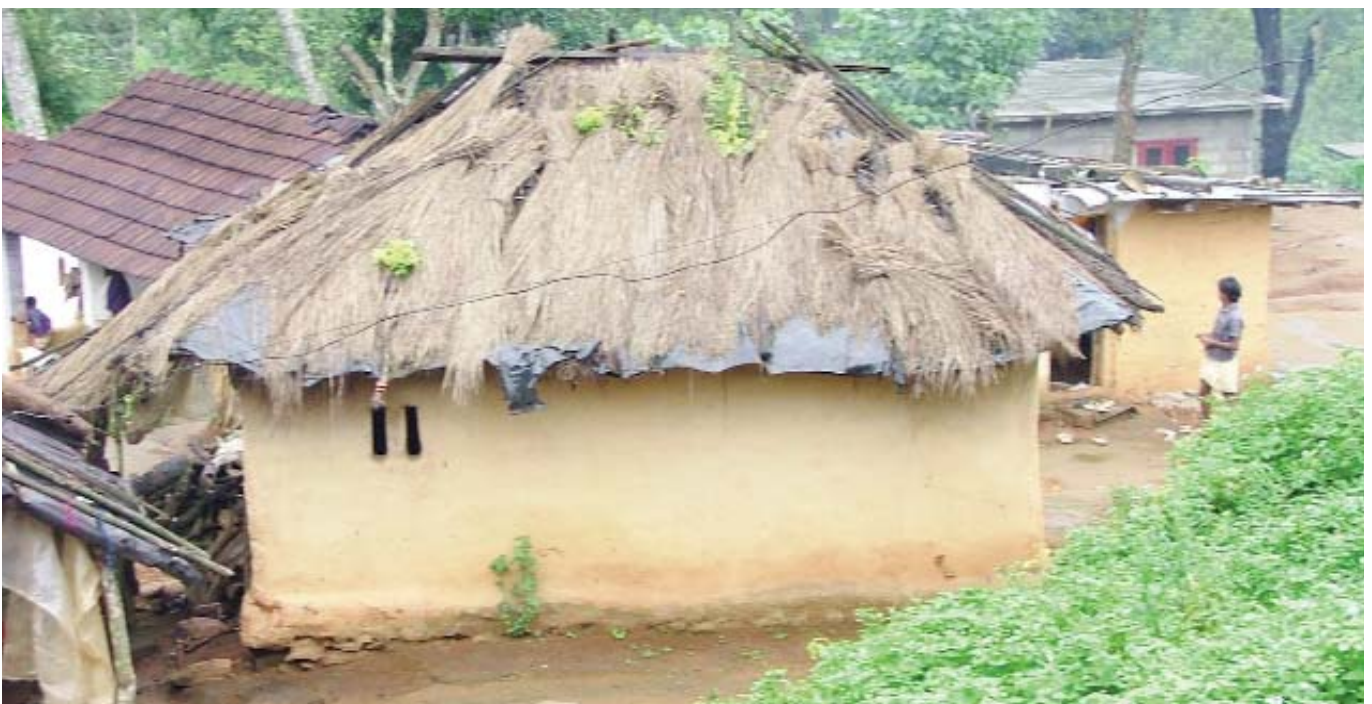
Daken van landbouwplastic en riet.

Het dorp dat bezocht werd heet 'Kaumali Kudi', dat 'Dorp van de clown' betekent ('Kaumali' = 'clown' en 'Kudi' = 'dorp'). Vroeger heette het dorp "Dorp van de mooie bloemen", zoals vele dorpen naar een bloem werden genoemd. Sinds er een man heeft gewoond die clown was, verwijst de naam naar hem.